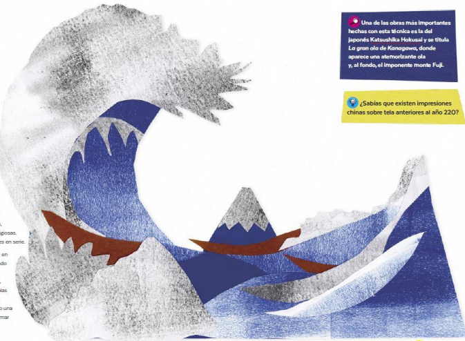
La gran ola de Hokusai (1826). A. T. Z.

Hoy esta técnica tiene un uso artístico, en donde la o el xilógrafo estampa su grabado sobre papel, y luego firma cada una de las imágenes. Si las miras con detenimiento, podrás descubrir que ninguna de las copias es idéntica a la otra, lo que las hace aún más valiosas. ¡Un buen ejemplo de cómo una técnica de producción se puede transformar en arte!